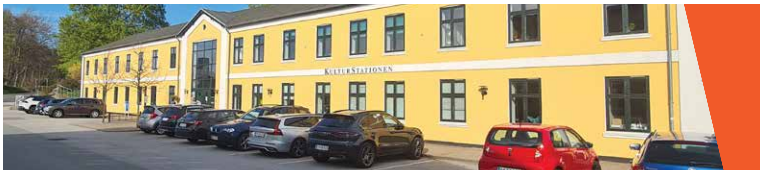
Plan over KulturStationen og de forskellige scener

Litterært Folkemøde byder på et bredt program, hvor der er lagt vægt på mangfoldighed. Fem scener og en stor markedsplads med boder, hvor du kan møde repræsentanter fra de mange litterære selskaber. Rigtig god fornøjelse.