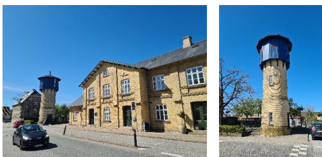
Skørping Station ligger lige overfor KulturStationen og Kinorevuen, hvor Litterært Folkemøde foregår 1. og 2. oktober 2022.